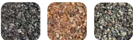
Farbeispiele für separat gekauften Splitt

Ihr Splitt hat ausgerollt. Lose Steine auf Gehwegen oder Rasenflächen müssen nicht sein. Mit ROMPOX® - PROFI-DEKO lassen sich Splitt und Kies verkleben und somit eine trittsichere, optisch ansprechende Fläche herstellen. Besonders für Baumumrandungen, auf Friedhofswegen oder Spielplätzen, um Bänke oder zu dekorativen Zwecken, mit dem 2-Komponenten-Kunstharzbindemittel für gewaschenen, getrockneten und staubfreien Splitt/Kies lassen sich alle Projekte im öffentlichen Bereich realisieren. Die Flächen sind wasserdurchlässig und leicht zu reinigen.